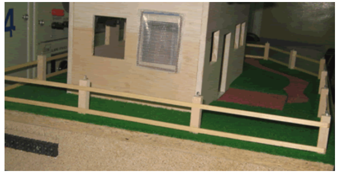
Zaščitna mreža na oknu