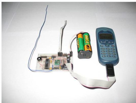
Tiskano vezje glavnega dela.