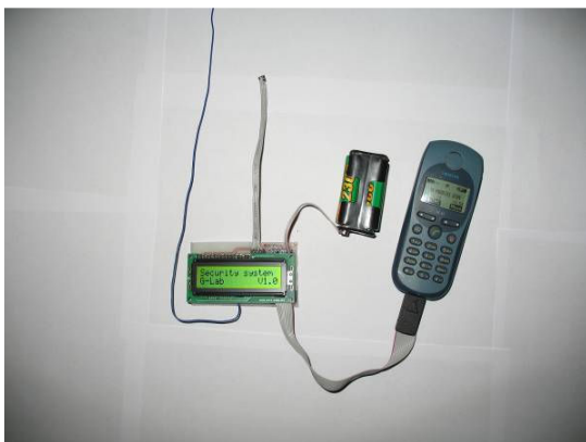
Na sliki je glavni del vezja v fazi testiranja. Na skrajni levi strani je antena za komunikacijo z aktuatorjem, sledi gravitacijski senzor, baterijsko napajanje in GSM.