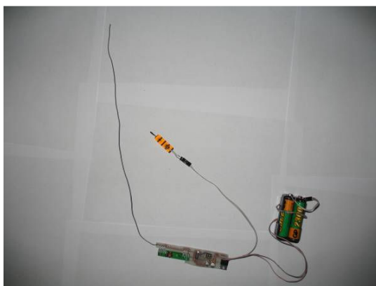
Aktuator. Sprejemni del z vžigalnikom (na sredini), ki naj bi poskrbel za luknjo v zračnici.