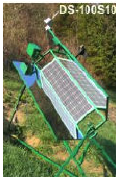
Sistem, pripravljen za optimizacijo pozicioniranja.